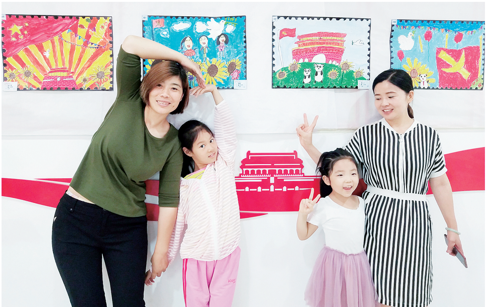
6月28日,豫龙镇宁山社区举办了“童心向党,快乐成长”主题绘画展活动。出自辖区孩子们的100多幅绘画作品进行了展览,并邀请了辖区新艺代、美蒙、盛武堂等3个绘画辅导机构的绘画老师前来做评委。此次活动辖区孩子及家长、党员、群众等共计100多人前来参观欣赏。