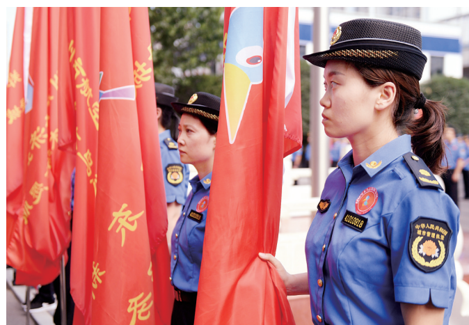
昨日, 我市举办了“绿城啄木鸟志愿服务支队”成立誓师大会

对于发现的问题, 志愿者能直接解决的自行解决, 不能解决的, 可通过本级“绿城啄木鸟”微信群、12319市民热线、智慧城管APP、在城管网报单四种方式上报处置。