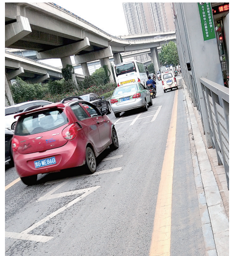
昨日, 南三环嵩山路口, 社会车辆闯入公交专用道