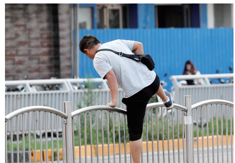
昨日下午, 创新大厦旁的文化路上, 行人翻越隔离栏