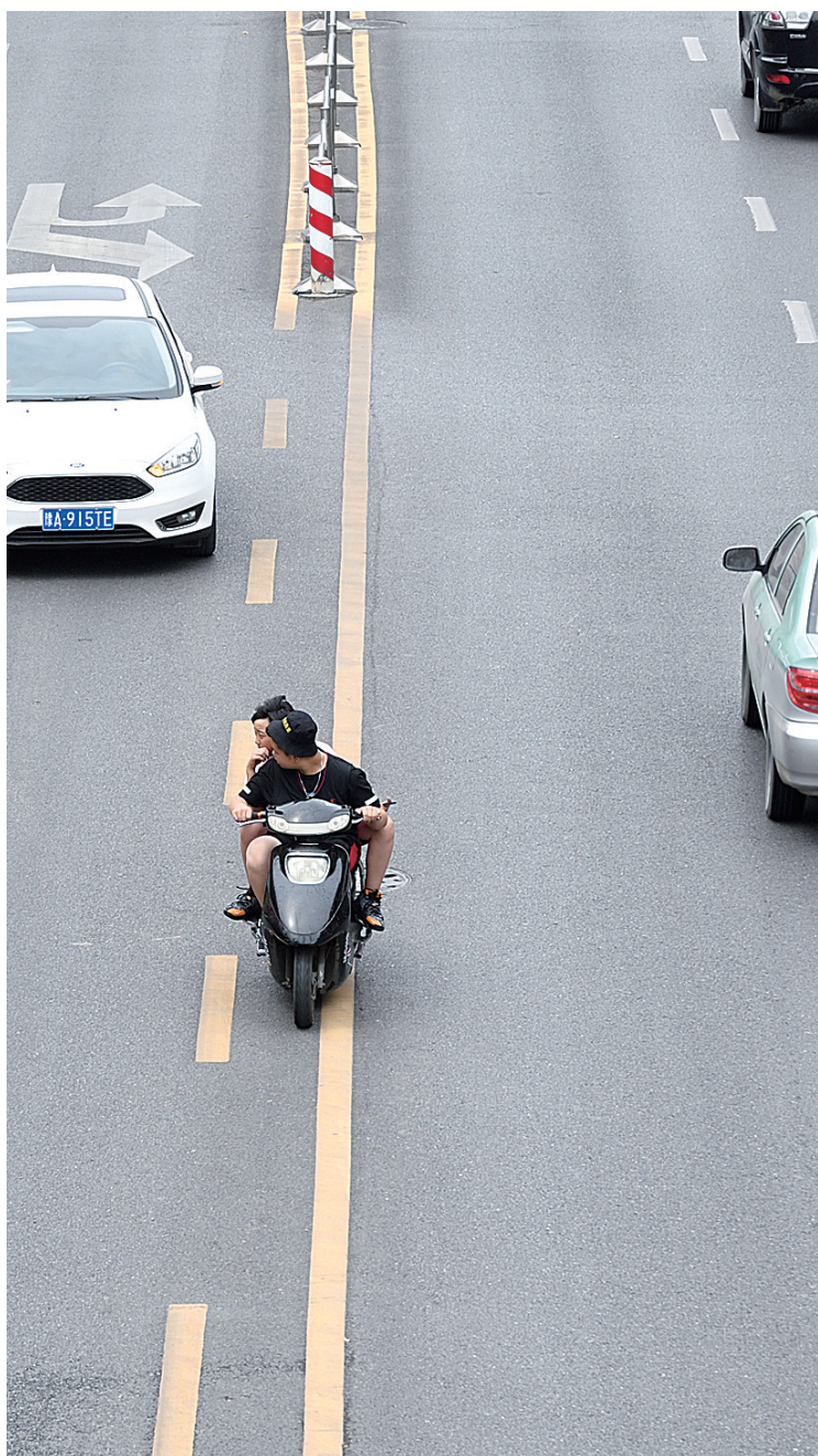
昨日中午, 紫荆山路商城路交叉口, 电动车载人行驶在双黄线上