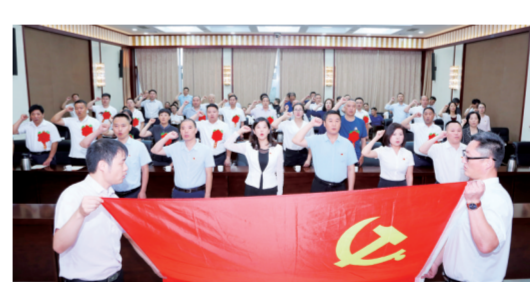
新郑市机关事务管理局