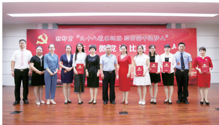
新郑市微党课比赛