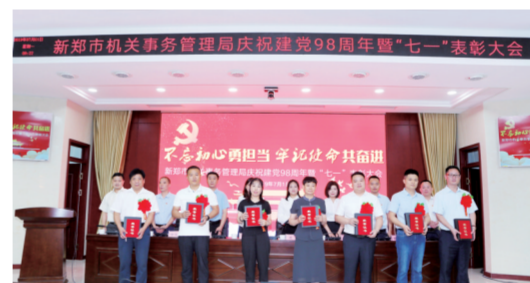
新郑市机关事务管理局