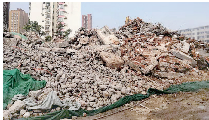
中央商务区D3地块一拆迁工地

本报讯(郑报全媒体记者 张玉东 实习生 许子初文/图)7月9日,记者跟随市污染防治督察组联合执法处对二七区、中原区部分建设项目和企业进行督查,共计督查12处(工地8家、企业4家),其中复查2处,共发现问题6处。