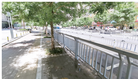
豫兴路办事处 祥符路