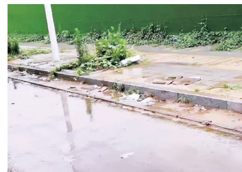
杨桥办事处 万滩村北段(雨润商贸公司—万滩村东边界)

整改措施:责令施工方立即停工,整改完毕后方可复工;组织洒水车和环卫工人对路面进行冲洗和打扫;联系相关部门对围挡及人行道板砖进行修复