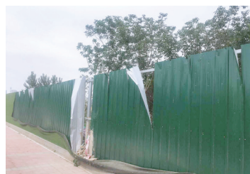
龙源办事处 龙源十街

整改措施:针对存在的这些问题办事处已经联系相关部门进行整改;联系交警部门对机动车和非机动车乱停乱放的问题进行整治