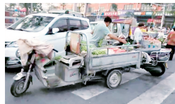
博学路办事处 慎思北里(中道西路—修业街)

整改措施:加大力度进行专项整治;对占道经营比较严重的路段加派力量;早高峰和晚高峰时期进行一个重点的整治