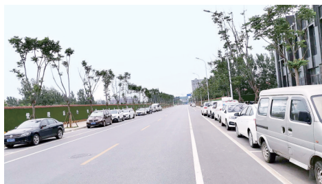
龙子湖街道办事处 夏庄街(明德街至薛夏南街)

道路亮点:门前四包到位、无出店经营、无乱堆乱放、空调外机放置规范标准、路面洁净、车辆停放有序