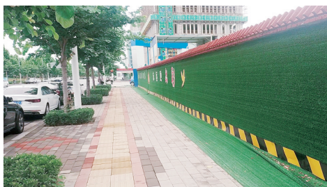
博学路办事处 尚贤街(博学路—明理路)