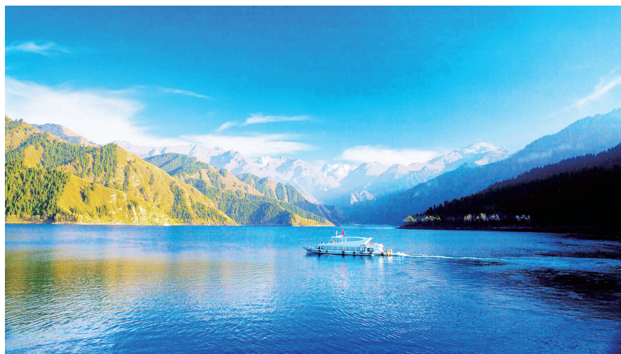
乌鲁木齐天山天池(资料图片)

更丰富的齐齐哈尔扎龙自然保护区,漠河北极村、根河湿地等景点。A线:哈尔滨、吉林长白山天池、海拉尔、呼伦贝尔大草原、满洲里、齐齐哈尔、扎龙湿地、山海关、北戴河、沈阳故宫、张学良少帅府2580元起;B线:漠河北极村、额尔古纳根河湿地、哈尔滨、吉林长白山天池、海拉尔、呼伦贝尔大草原、沈阳故宫、张学良少帅府、山海关、北戴河2980元起。8月13日东北三省+漠河北极村+呼伦贝尔草原+北戴河专列,3180元起,如果您去过北戴河还可以选择不去北戴河仅需2980元起。