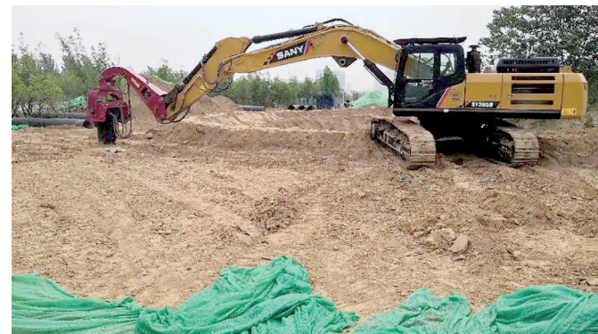
侯寨水厂工程鼎盛大道段

本报讯(郑报全媒体记者 张玉东 实习生 许子初 文/图)7月16日,记者跟随市环境污染防治督导组综合执法处对郑州市部分政府投资工程、民生工程、市政道路工程进行巡查,共计巡查7处(企业1处)。