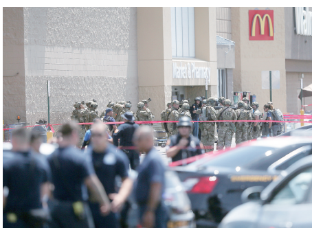
大批执法人员赶到现场

一名顾客说,他与母亲躲在两台自动售货机之间,躲过一劫。“那个人向我开枪,但是没打中”。