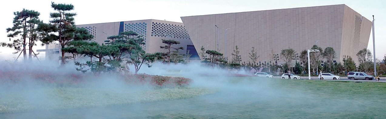
昨日,郑州奥体中心东北角附近正在测试的雾森系统,营造出梦幻般的美景,如同仙境一般。