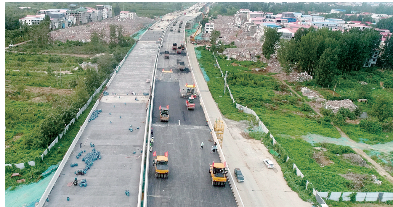
西四环四标段(故城路—大河路段)高架在做沥青摊铺

本报讯(郑报全媒体记者 曹婷)“8月20日前,西四环高架主线(除孔河桥处外)及郑上路—陇海路地面道路具备通车条件。”昨日,来自市城乡建设局的最新消息,郑州四环建设已经进入冲刺阶段,离全线贯通又进一步。目前各施工单位正在严抓规范操作,确保质量、安全,加快推进施工进度。