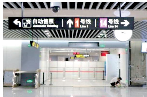
与1号线换乘站——铁炉站

本报讯 第11届全国少数民族传统体育运动会即将在郑州开幕,大家一定都很想亲临现场感受运动健儿的风采。怎样方便快捷地到达奥体中心呢?好消息来了,地铁14号线一期月底即将开通,届时,大家去奥体中心附近就更加方便了。