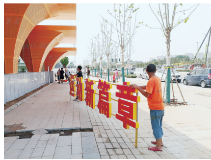
地铁口鲜艳的色彩营造了热烈的气氛