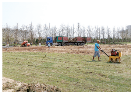
地铁口附近绿化正在进行