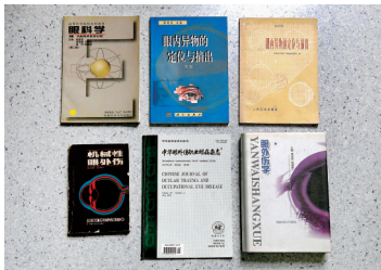
张效房参与编写的部分书籍、杂志