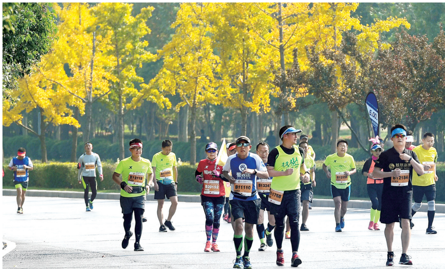
2018郑州国际马拉松赛现场

完成过100多场马拉松赛道丈量工作的闫俊涛对国内众多马拉松赛道非常熟悉,去年的郑马赛道丈量工作就是由他完成的。对于郑马调整升级后从CBD到CCD、东西穿越城区的赛道规划,闫俊涛表示:“这是一条充满诚意的穿城线路,展示了郑州这座城市对马拉松跑友的最大诚意。”