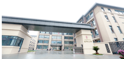
经开区世和小学校门