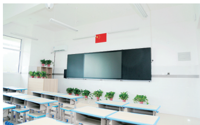
经开区瑞绣小学教室整洁明亮