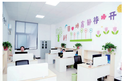
经开区世和小学办公室