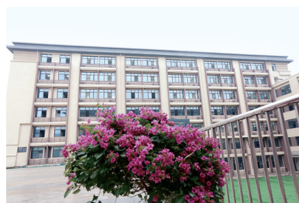
经开区第五中学繁花盛开