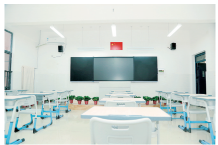
经开区外国语学校教室