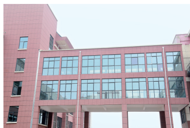
外国语小学教学楼