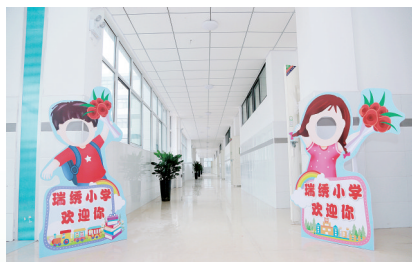
经开区瑞绣小学欢迎你

本报讯 马上开学了,你是不是正在为新学期的到来准备书包、学习工具呢!其实,咱们经开区的教育人也没有闲着。为了能让即将入学的孩子们提供安全、舒适的学习环境,8月21日上午,经开区对2019年秋季拟投入使用的6所新建学校逐一进行全面检查。