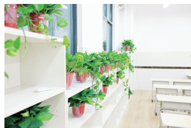
泰和小学温馨的环境布置