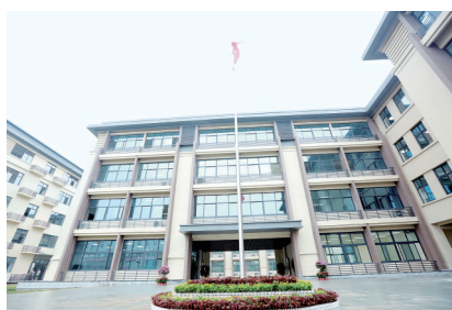
经开区世和小学教学楼