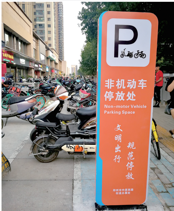
非机动车停放区域

本报讯(郑报全媒体记者 张华 文/图)8月23日晚高峰,昔日拥堵的中原路华山路口,交通秩序井然,路口渠化后变宽变美。周边商圈划定非机动车停车区域不收费,只要在划定区域内按要求停放即可,市民逛街放心更舒心。