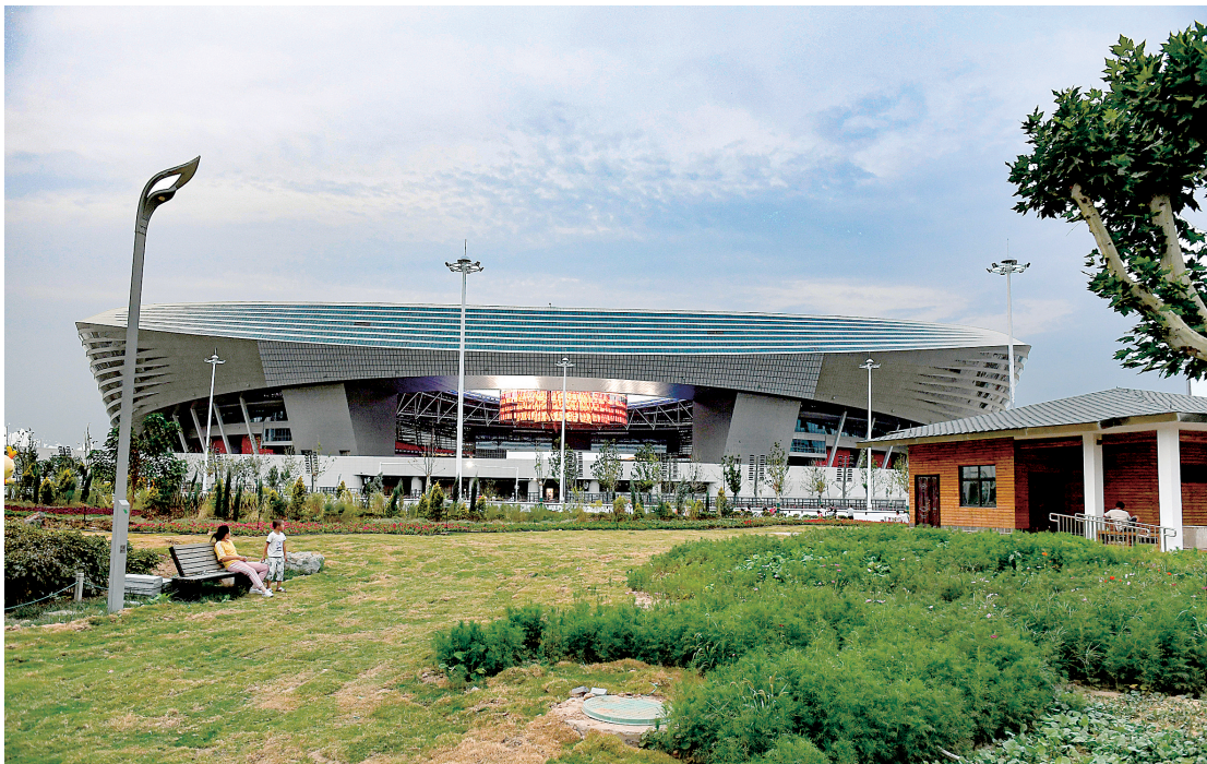
站在植物园看奥体中心，建筑与园林完美融合

为了打造该景观，市园林局、郑州植物园从7月初就开始播种波斯菊、金鸡菊、百日草等草花，全园打造花带景观4处，共计5万平方米，在民族运动会期间将形成最佳的花海景观。