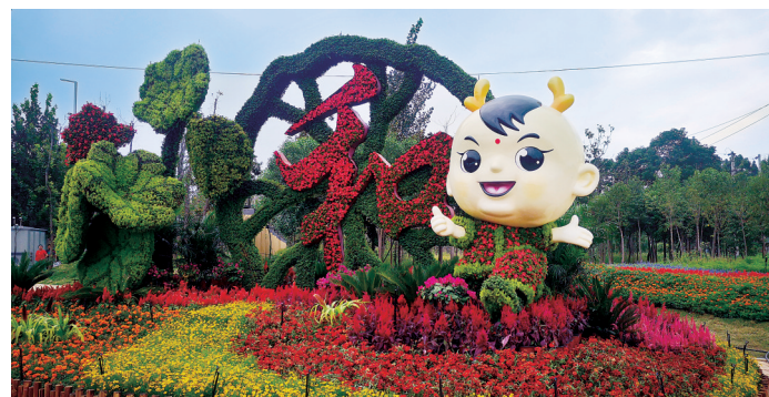
植物园景观提升

本报讯(郑报全媒体记者 裴其娟 通讯员 王霞)第十一届全国民族运动会开幕在即，位于核心区域的郑州植物园增添了许多新的景观，处处花团锦簇、喜庆祥和，营造出民族大联欢、大团结的浓厚氛围。