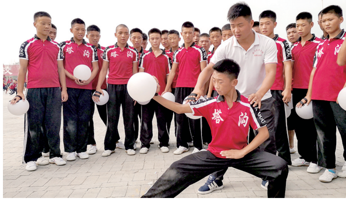
演员们对一招一式进行更加精细地雕琢和打磨

数次的联排和第一次彩排中均达到了预期效果,据导演组介绍,9月8日前是节目冲刺的第三阶段,整个彩排和细节问题,包括学生对灯光、舞台、