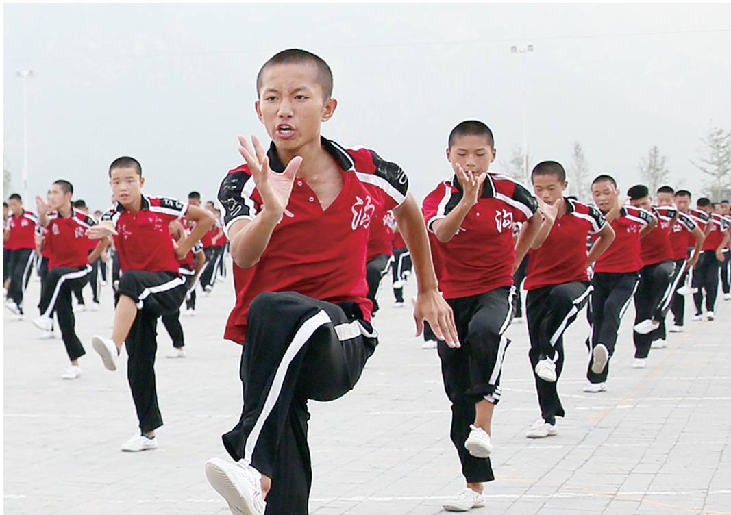
塔沟武校共有9000多名演员参加第十一届全国民族运动会的各项演出

而这,只是塔沟武校参演本次全国民族运动会节目的一部分,作为大型活动演出“专业户”的塔沟武校,此次共有9000多名演员参加开幕式、闭幕式、民族大联欢、表演项目、登封迎宾活动等系列活动,是参加人员最多的团体,堪称本次盛会大型演出中的生力军。