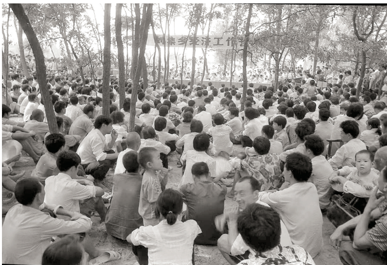
乡会 1989年 摄于刘集乡