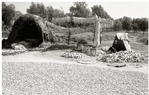
晒大枣 1982年 摄于八岗公社宋庄村