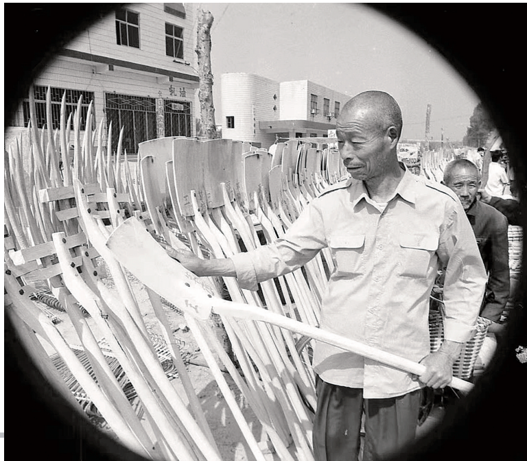
选木锨 1986年 摄于大孟小满会

本报讯 摄影是历史的画笔,是时光的记录。中牟县刘集镇段庄村段双奇,20多岁开始就扛着相机奔走在田间地头,用镜头记录着农村的变迁和发展——本组照片拍摄于20世纪80年代的中牟大地。为庆祝中华人民共和国成立70周年,本报将陆续发表段双奇拍摄的关于农业、农村、农民的老照片,以飨读者。 中牟时报 马沂峰