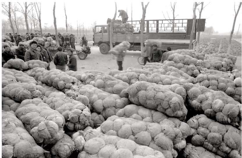
蔬菜集散地 1988年 摄于刘集乡冯庄村