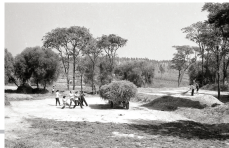
秋收季 1987年 摄于白沙乡冉庄村