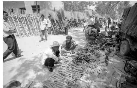
选镰刀 1985年 摄于刘集乡贺庄村

本报讯 摄影是历史的画笔,是时光的记录。中牟县刘集镇段庄村段双奇,20多岁开始就扛着相机奔走在田间地头,用镜头记录着农村的变迁和发展——本组照片拍摄于20世纪80年代的中牟大地。为庆祝中华人民共和国成立70周年,本报将陆续发表段双奇拍摄的关于农业、农村、农民的老照片,以飨读者。 中牟时报 马沂峰