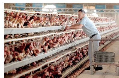
兰考县张庄村村民在自家养鸡场内收鸡蛋。摄于2019年9月

2014年,习近平总书记在兰考考察调研时曾提出一个发人深省的问题:焦裕禄在兰考工作时间并不长,但给我们留下这么多精神财富,我们应该给后人留下什么样的精神财富?回眸峥嵘岁月,展望美好前景,张庄人正在用实际行动践行总书记的殷殷嘱托,决心用脱贫致富的成效实绩和群众的认可满意,将焦裕禄精神这块“金字招牌”在新时代擦得金光闪闪、熠熠生辉。