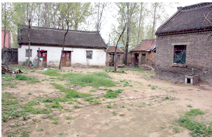
脱贫前的兰考县张庄村一处民居。摄于2014年5月