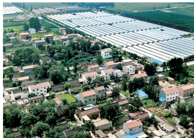
现在的兰考县张庄村村貌和种植大棚。摄于2019年9月

近日,我们来到黄河边这个小村庄,一边走一边看,一边听一边记,深刻感受了脱贫攻坚战的火热与壮观。