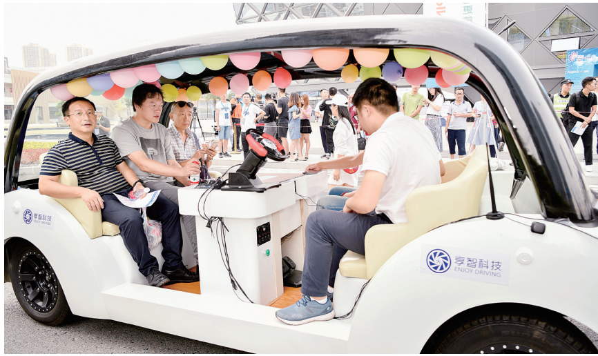
8月28日,国内首个5G自动驾驶开放道路场景示范运营基地在重庆迎来公众体验日