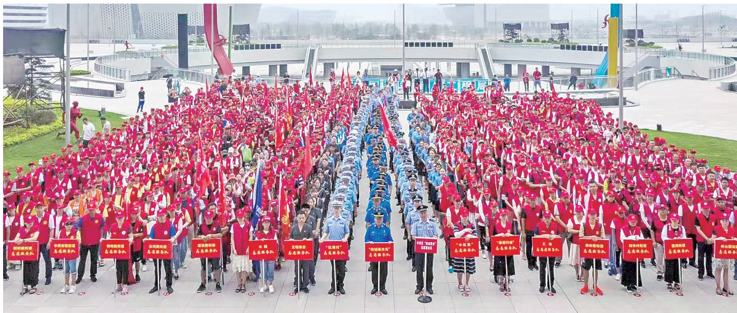
来自各行各业的志愿者