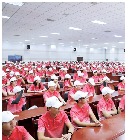
对志愿者进行专业培训