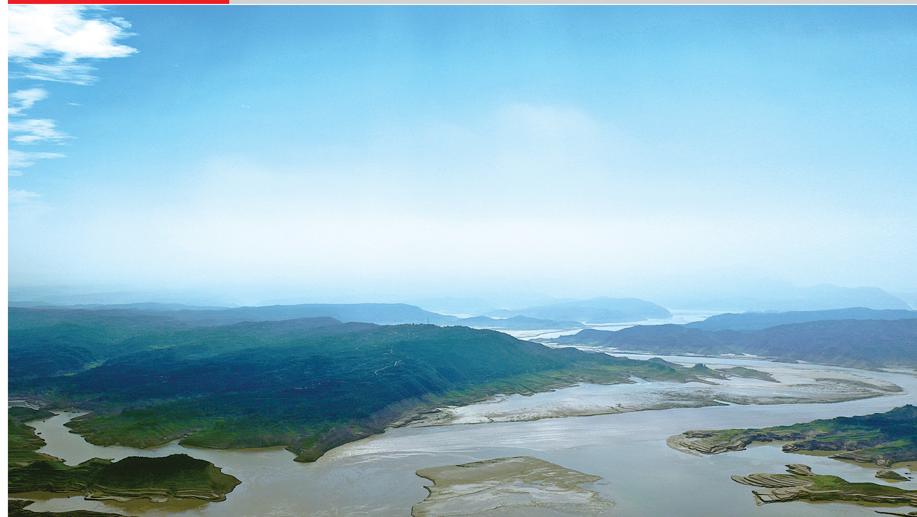
7月25日拍摄的黄河小浪底水库一角(无人机拍摄)