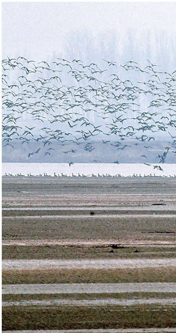
长垣县境内的黄河湿地成群大雁飞过

滔滔大河,蜿蜒九曲,宛若一条金色的缎带东入大海。在人们的印象中,“黄河之水天上来”,一路奔流入海,但其实在20世纪70年代以后的近30年,黄河曾多年出现断流。1999年起,国家实施黄河水量统一管理调度至今,黄河已经实现连续20年不断流。这条中华民族的母亲河,正在以全新的生命形态哺育着人民,也为世界江河治理与保护、人与自然和谐共生提供了典范。