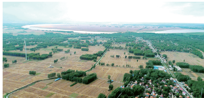
兰考东坝头乡张庄村附近拍摄的蜿蜒的黄河河道