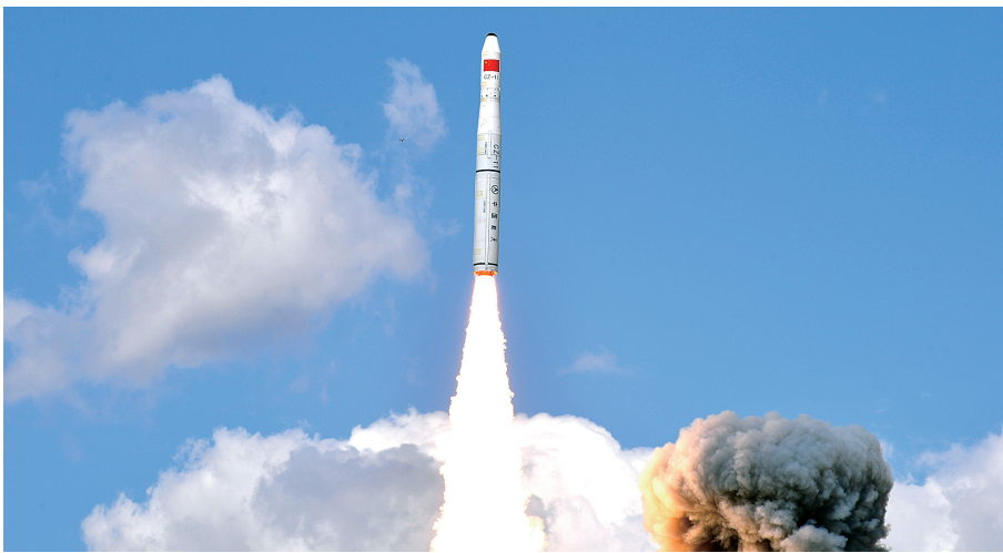
9月19日14时42分,我国成功发射“珠海一号”03组卫星