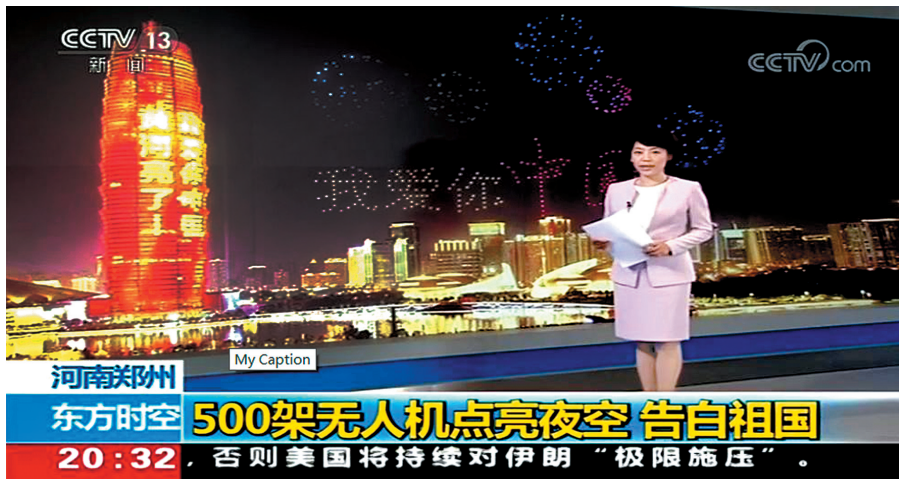
《东方时空》报道截图