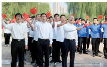
记者 孙庆辉 通讯员 贾濛 文/图

对祖国的热爱和歌颂祝福祖国的激情被迅速点燃,深情唱响《我和我的祖国》,共同向新中国70华诞献礼。70载风雨征程,70载沧桑巨变,“我和我的祖国,一刻也不能分割,我的祖国和我,像海和浪花一朵……”此次合唱活动,通过歌声回顾历史,坚定信仰,激发大家的爱国之情,用热情点燃心中的红色火种,以更加昂扬的姿态投入到实现伟大中国梦的行