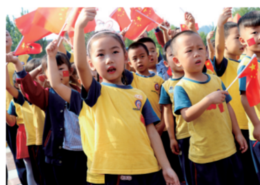
记者 孙庆辉 高新时报 方宝岭 通讯员 董丽 文/图

会成员手持国旗意气风发,精神饱满并带着最真挚的祝福唱响了《中国人》,给本次活动拉开序幕。小、中、大共14个班的孩子们及家长们齐聚广场,分别演唱《娃娃哈哈》《红星闪闪》《歌唱祖国》。在鲜红旗帜的映衬下,孩子们脸上都洋溢着自豪和喜悦,并以最热情的状态唱响我们的中国心,为祖国庆生送上一份诚挚的祝福。