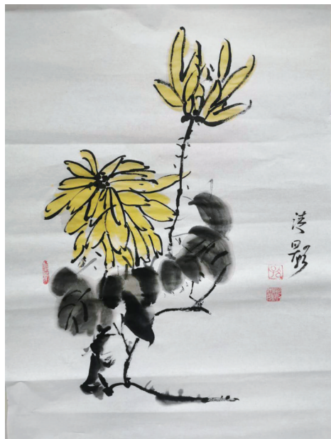
琴心的绘画作品《清影》

学校是一个育人的摇篮,是一方纯净的沃土,校园的文明直接折射出社会的文明。我们需要齐心协力,共同营造一个文明校园,让文明之花开满校园。