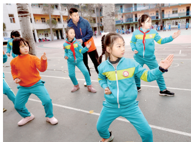
我市启动课后延时服务