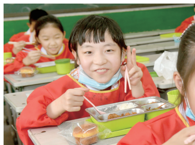
中小学午餐供餐工程暖人心