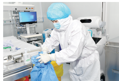
抗疫情,医护人员交出硬核“健康答卷”