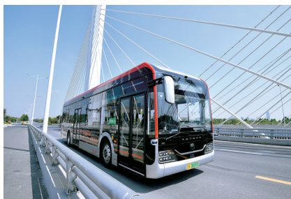
5G自动驾驶公交车在运行