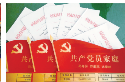
评比共产党员家庭