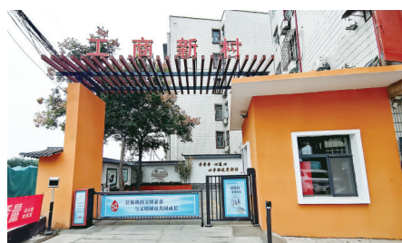
打造“工商新村”无主管楼院样板

坚持经济发展和城市精细化管理高质量 强力推进重大项目建设、加快新型城镇化建设、推动工业高质量发展,全力以赴实现阶段新突破;不断深化全国文明城市建设工作,加大生态文明建设力度,做好人居环境整治工作,常态化开展新时代文明实践主题活动,营造良好氛围,为争创全国文明典范城市贡献强劲力量。