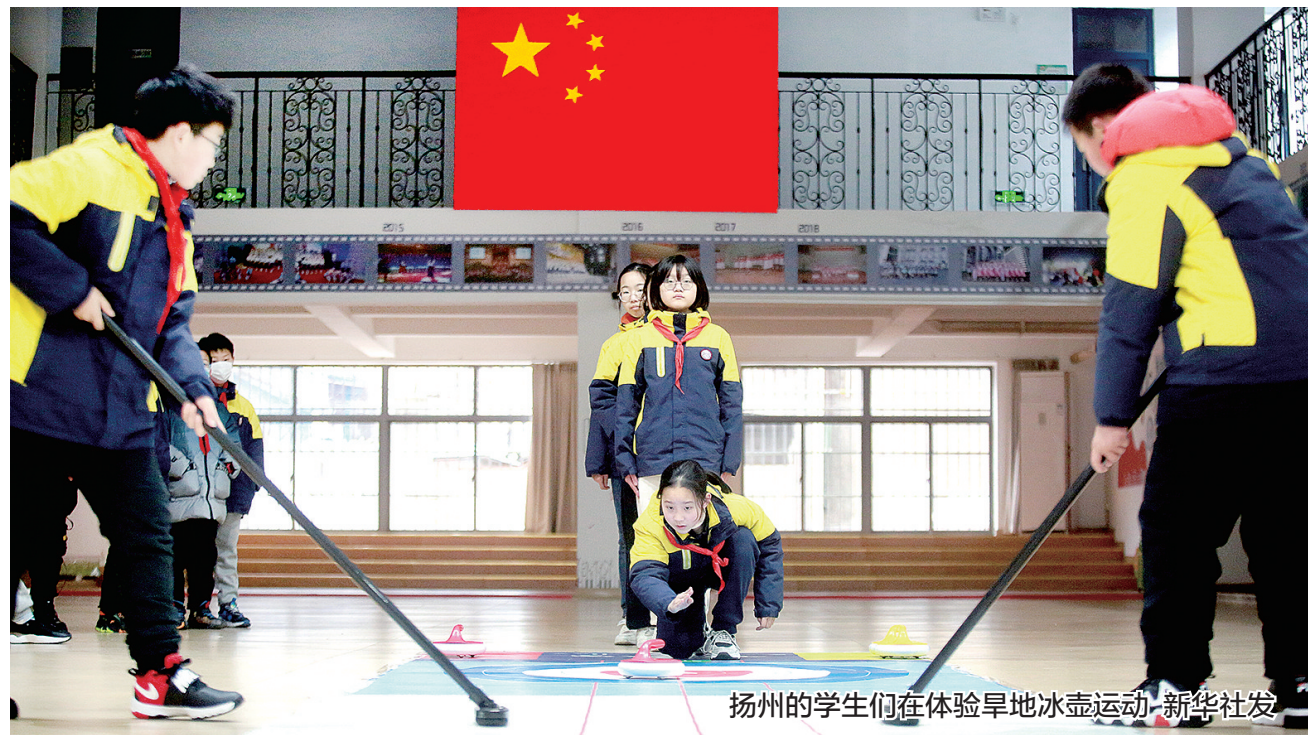
扬州的学生们在体验旱地冰壶运动。

新华社电 2月16日,晨光熹微。在山东济南舜耕小学的门口,一位老人正在给自己的小孙女照相。