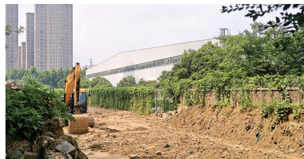
杜鹃路上有施工机械在作业