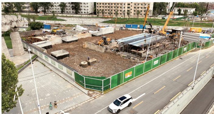
金水路与未来路交叉口围挡后撤并改成圆角

7月28日,经过两天的整改,该路段最南端封闭成直角的施工围挡被拆除掉,改成了圆角弧线施工围挡,路口交通视野顿时开阔。同时该处其余占路施工围挡后撤2米瘦身,拆除围挡230米,归还被占用的人行道和非机动车道供行人和非机动车通行,并在周边增加交通引导标志标线,确保安全顺畅出行。