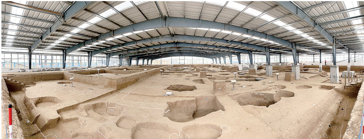
距今5300年的仰韶文化中晚期巨型聚落遗址——双槐树遗址

本报讯(记者 左丽慧)为了加强双槐树遗址的保护、管理、利用,推进中华文明探源工程,传承弘扬优秀历史文化,近日,河南省十四届人大常委会第十次会议批准了《郑州市双槐树遗址保护条例》,《条例》自2024年10月1日起施行。