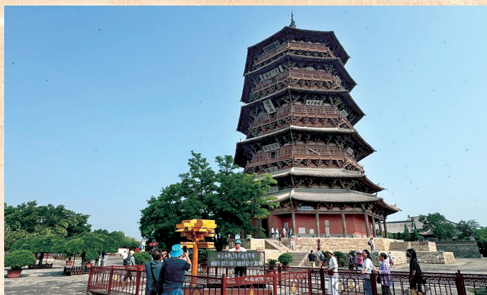
游客“打卡”世界最高木塔应县木塔