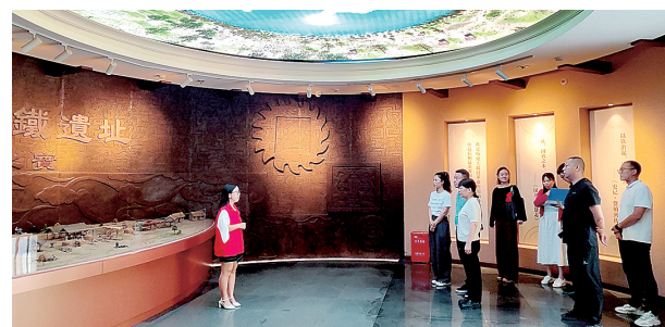
市民参观古荥汉代冶铁遗址博物馆

按照郑州市安排,惠济区新时代文明实践中心、惠济区文明办依托新时代文明实践中心(所、站),创新活动形式,打造沉浸式、互动式、体验式宣讲方式,将持续开展“文明探源我来说”文物和文化遗产保护文明实践活动,进一步增强群众对文物和文化遗产保护的意识,推动中华优秀传统文化繁荣发展。