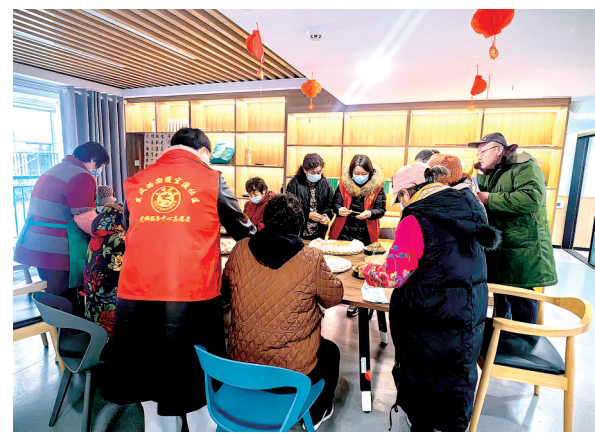
一起包饺子,其乐融融

本报讯(记者 张朝晖 通讯员 张华 徐少杰 文/图)随着冬至的脚步悄然临近,一场别开生面的“冬至包饺子 共享温情”活动在官渡社区日间照料中心上演。昨日上午,阳光明媚,官渡社区日间照料中心的大厅里洋溢着浓浓的节日氛围。