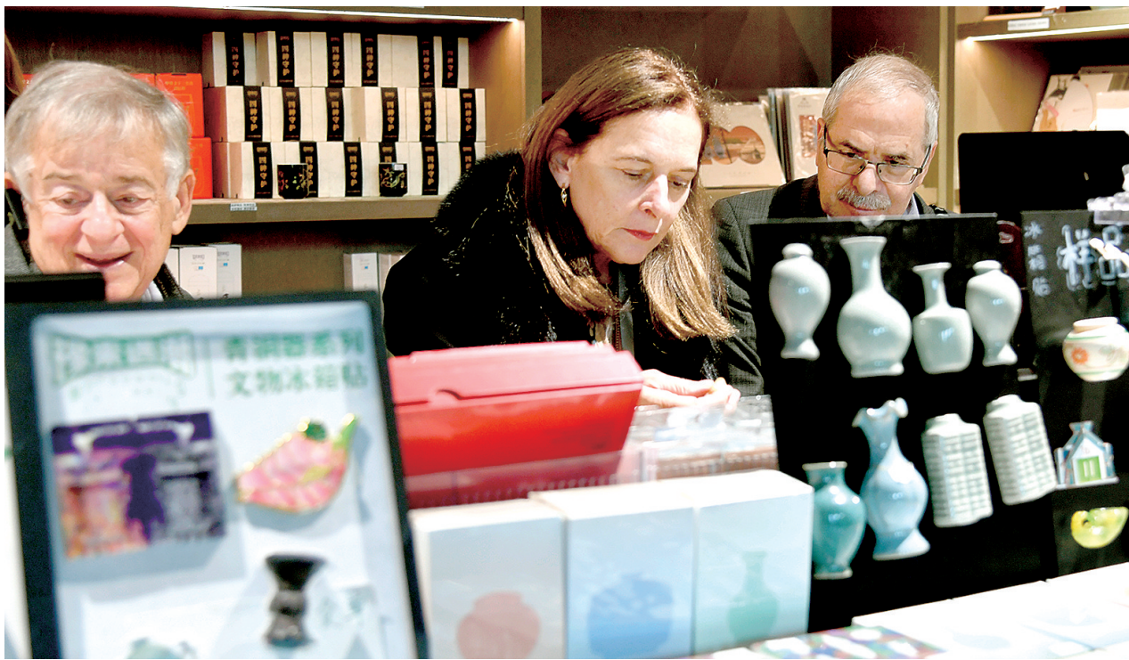
外籍专家学者被河南博物院文创产品所吸引

本报讯(记者 秦华 通讯员 杨轶然)为助力河南省博物馆文创事业迈向新高度,12月16日~17日,“推动博物馆文创高质量发展研讨会暨2024年河南省博物馆学会文创专委会年会”在河南博物院召开。