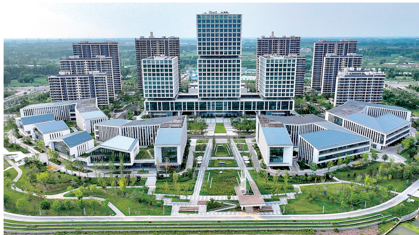
郑州鲲鹏软件小镇

会上，发布各类成果12项，108家数据要素生态企业与郑州数据创新中心签订合作协议，18家企业现场签约，数据要素市场化配置改革联合实验室揭牌成立，共谋数据要素发展之道，共建数据产业创新生态，加快释放数据要素潜力，探索培育新产业、催生新模式、形成新动能，为数字经济注入新的活力，郑州数据领域影响力再扩大。