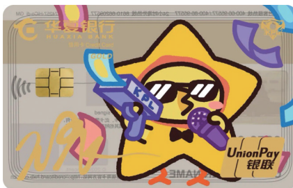
华夏银行KPL王者梦之队联名信用卡