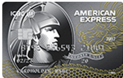
工商银行牡丹祥运信用卡