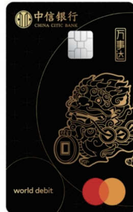
中信银行信运无界信用卡(爱家版)