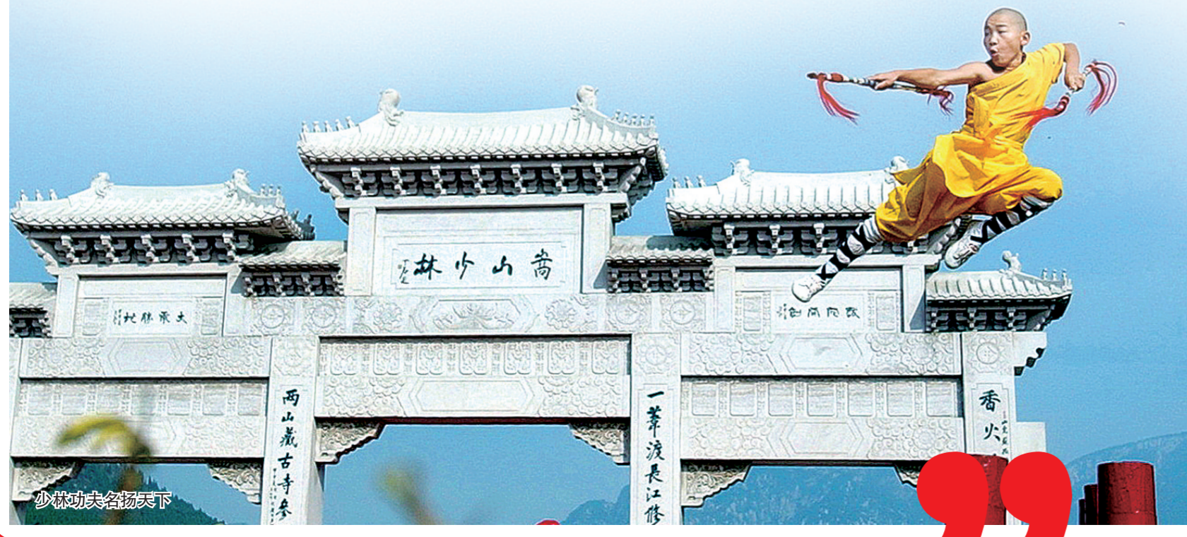
少林功夫名扬天下

在建设国际消费中心城市征程中,商都郑州一直在砥砺前行,务实拼搏。放眼郑州未来发展,宋向清充满信心地说,此次会议特别强调了以国际消费城市建设为总抓手,大力实施提振消费专项行动,形成以“中华经典、世界品牌、时代时尚”为鲜明特色的国际消费中心。会议还提出要全力打好消费促进“组合拳”,持续扩大消费品以旧换新活动覆盖面,扩大优质消费载体,加快打造一批特色街区、消费地标和夜经济聚集区。这意味着郑州将进一步挖掘消费潜力,打造多元消费场景,大力发展首店经济、夜间经济,培育特色商圈,进一步提升商品与服务品质,增强消费对经济发展的基础性作用,吸引更多国内外游客来郑休闲度假。记者 成燕 文/图