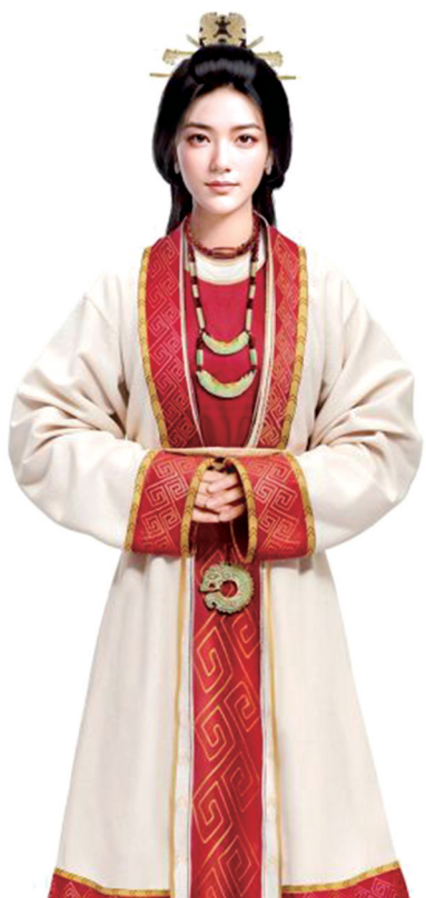
安阳殷墟“数智人妇好”

越来越聪明的数据“大脑”,为文化和旅游部门把握市场趋势、提升公共服务、强化安全应急提供更有力量支撑,也为旅游治理提质增效添砖加瓦。