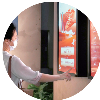
观众在上海中共一大会址纪念馆的展览上通过互动装置了解相关信息

需求引领、创新驱动,不论是内容生产创新、产品和业态创新,还是商业模式创新、治理方式创新,科技正加速融入文化和旅游生产和消费各环节,催生更多文旅新气象。