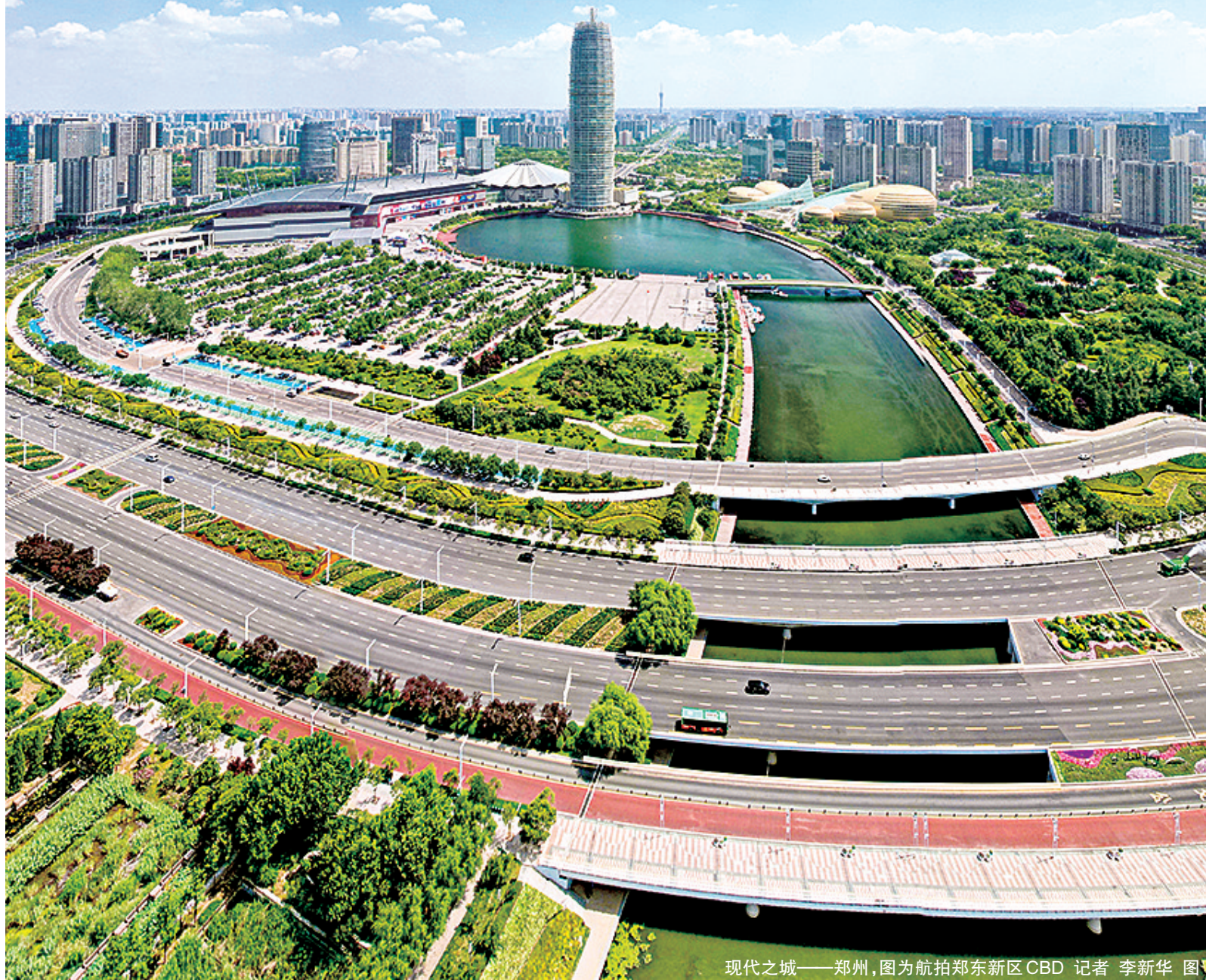
现代之城——郑州，图为航拍郑东新区CBD