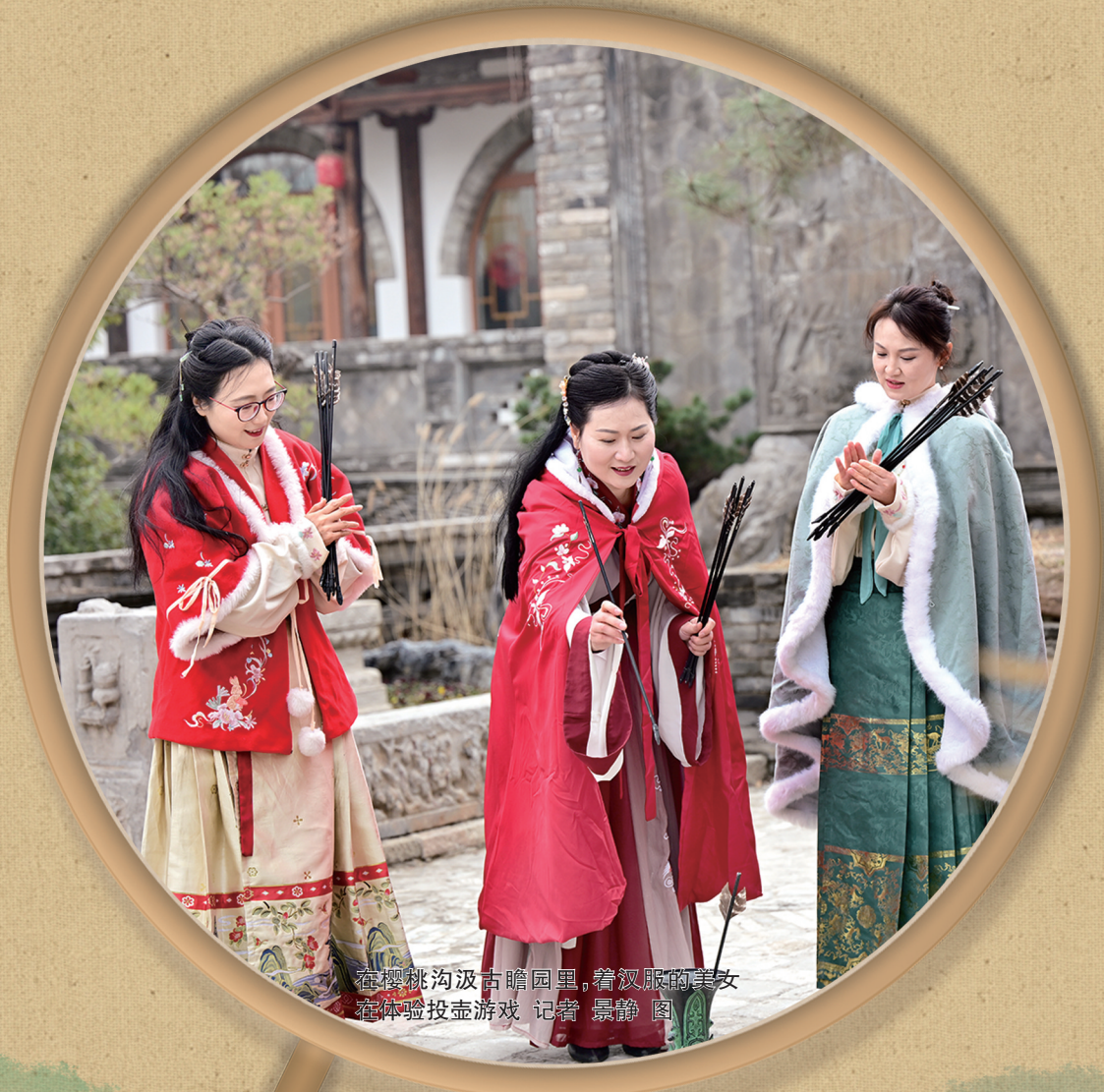
在樱桃沟汲古瞻园里，着汉服的美女在体验投壶游戏