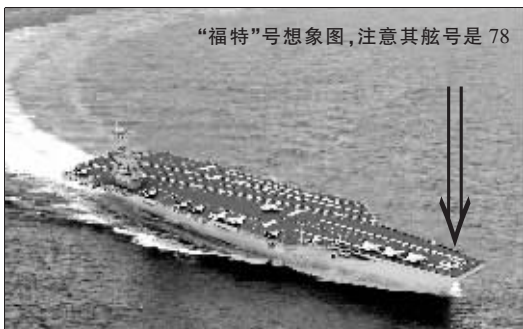
“福特”号想象图,注意其舷号是78