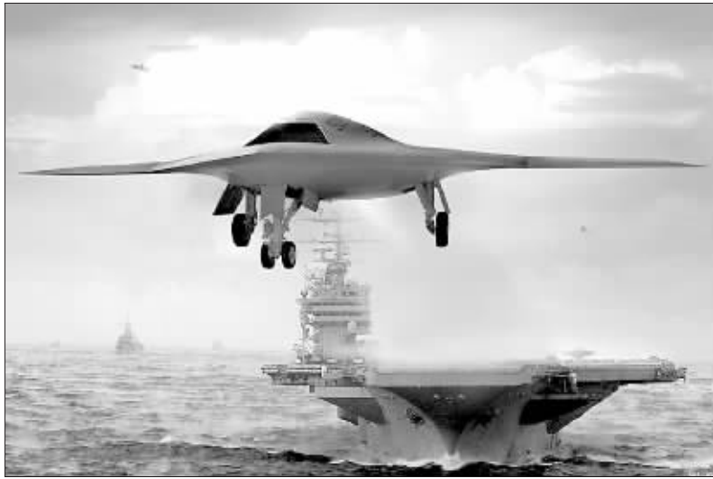
CVN21新型航母上将部署无人战机J-UCAS(想象图)。“福特”号在飞机出动架次方面,将比“尼米兹”级提升20%;在提高生存能力、更好地应对未来威胁方面,将提升25%的作战能力;另外还将加装飞机电磁弹射系统。 微言