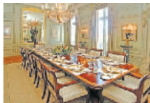
超大餐桌可供数十人就餐