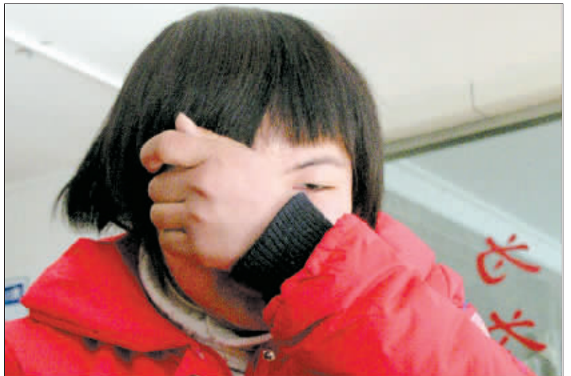
云云向警方哭诉自己的遭遇。 晚报记者 常亮 实习记者 赵楠 图

云云找到母亲,在那儿度过了快乐的20天,但云云发现,母亲虽然也是被拐卖到这里,由于时间已经过去10年了,还有一个小妹妹,继父、弟弟、妹妹一家四口生活在农村,日子虽也过得紧巴巴的,但母亲已经