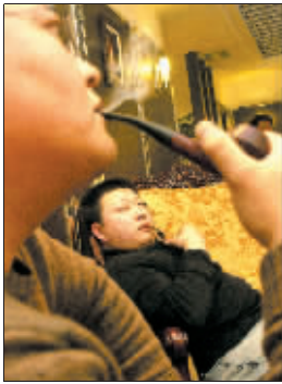
一斗烟,谁坚持的时间最长谁就获胜。