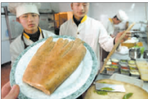
像不像手掌? 晚报记者 廖谦 图