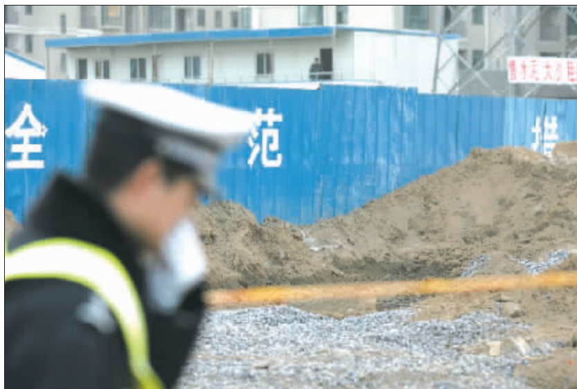
维持秩序的民警捂着鼻子从现场走过。