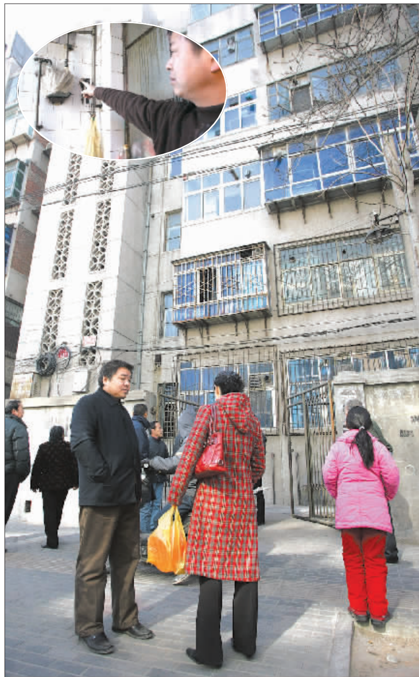
一名住户介绍漏气的位置(图中圈)。居民被民警疏散出现场,在外面等候。