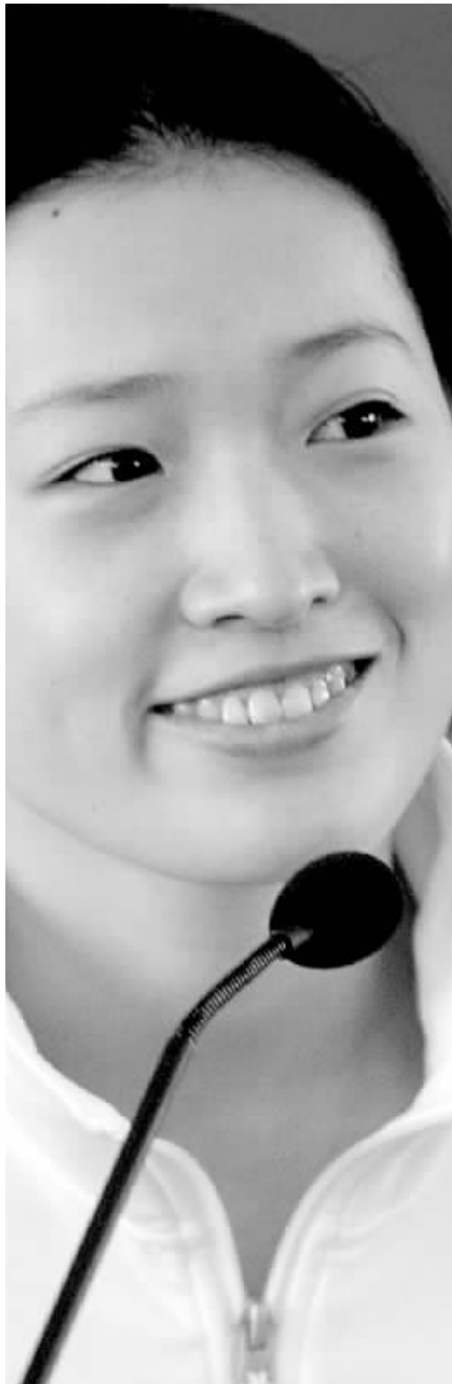
罗雪娟笑靥如花