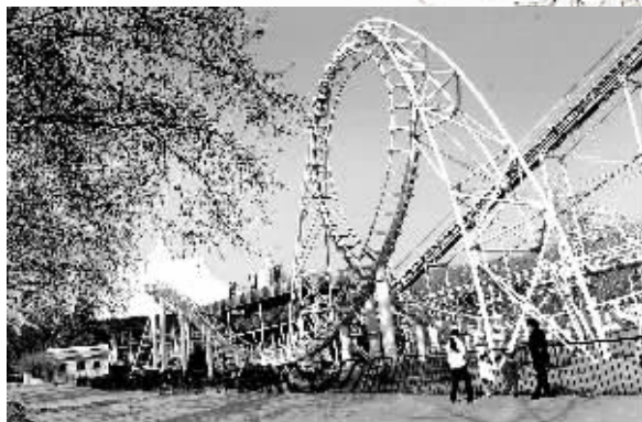
人民公园内的过山车。

每天天一亮,人员就陆陆续续都到了,唱前苏联老歌,唱传统歌曲,唱抒情歌曲,在演唱的过程中锻炼了身体,陶冶了情操,愉悦了生活。通过演唱活动,每个人都找到了归属感和成就感。有些人的身体不好,参加了演唱团好多了,有些人的心态不好,进入演唱团以后也变得活泼开朗了。