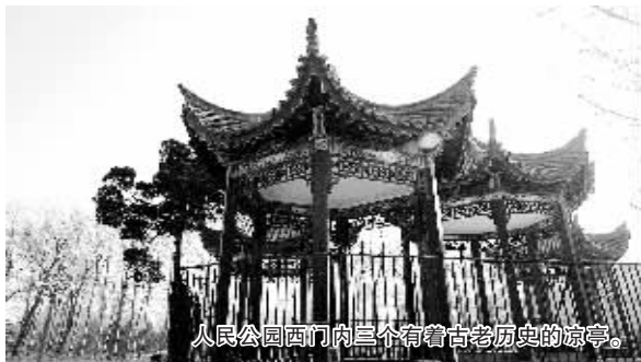
人民公园西门内三个有着古老历史的凉亭。

他很喜欢公园能再建几间茶馆,既可供游客歇脚,还能在里面搞些活动,比如唱戏、说评书等。“我很喜欢讲评书,可现在在郑州已经找不到当年老坟岗茶棚听书讲书的氛围了。”