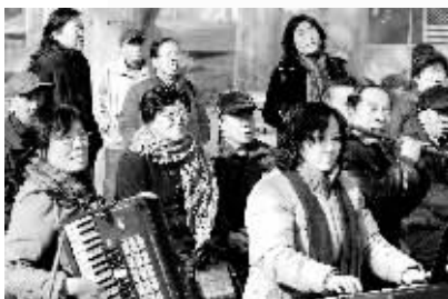
歌友们在人民公园放歌,成为一道景观。