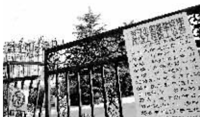
正处于基础设施改造工程中的人民公园。

的是父母竟然把我往这怪物身上架,我吓得哭了起来,弄得父母一头雾水。”已为中年的她,谈起这个竟然高兴得笑个不停,内心的喜悦如脸上的红云,簌簌的飘起来带着她的思绪飞入那美妙的童年时代。“后来去的次数多了,便喜欢上了这种玩具,从上面下来,刺激又好玩,呵呵,就是滑滑梯。还有就是溜溜板,是同学教会我的。自从知道了怎么玩之后一有时间就来玩。印象深刻的还有公园里西门草坪上的梅花鹿雕塑。虽然现在公园多了很多现代化的游乐设施,但看着总觉得心里不是滋味,还是喜欢以前的东西,工农兵雕像、茶馆、露天剧场等。”