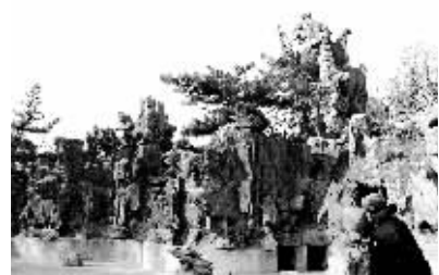
人民公园内的假山伴随很多市民度过难忘的童年时光。