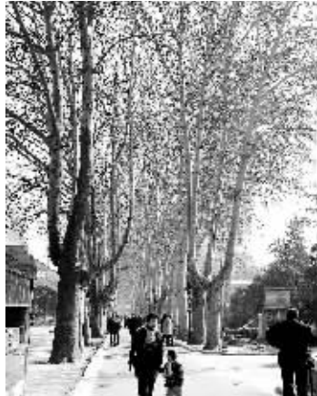
人民公园内高大整齐的法国梧桐。