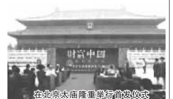
在北京太庙隆重举行首发仪式

物汉代云纹瓦当。作为我国的一种符号,瓦当素有“秦砖汉瓦最难求”的美誉,自古被视为镇宅避邪、世代平安富贵的吉祥之物。据钱献之的《汉瓦图录》记载,“长乐无极”瓦当在乾隆年间的价格就达到了每枚白银百两,2001年国际拍卖会上,一枚汉代云纹瓦当成交价高达11万元。