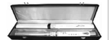
(主席金像、长征金卷全套组合 收藏装裱两相宜)

在发行现场王先生讲“不管你是送礼还是收藏,一定要选有价值有增值潜力的品种,五六十年代纸质印刷的主席像已升值几十倍,现在买都买不到,而今天国家发行的主席金像和《长征》是国家行为、国家信誉。发行量少,单是黄金就价值不菲了,将来不涨都不行。年末了我买两套送我的领导和朋友。”