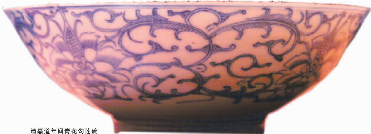
清嘉道年间青花勾莲碗