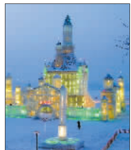
哈尔滨冰雪大世界

冰雪盛宴合家欢，去哈尔滨冰雪大世界、吉林雾凇、北大湖滑雪、长春净月潭五日游，可以充分体验北国冰雪盛宴。